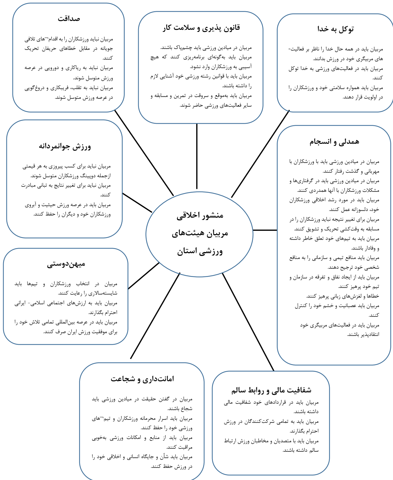
شکل ۳. منشور اخلاقی مربیان هیئت‌های ورزشی استان مرکزی