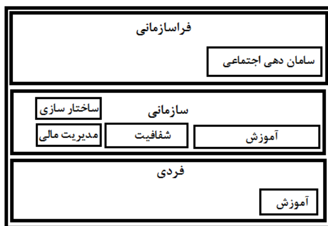
شکل ۱. سطوح راهبردهای مبارزه با تبانی در ورزش

سپس محقق به شناسایی کدهای مربوط به راهبرد پرداخت که در نهایت بعد بررسی ۳۹ کد شناسایی شد که در قالب اصلاح مدیریت مالی (نظام پرداخت و رفاه)، آگاهی دهی (جنبه‌های تبانی، عواقب تبانی)، شفاف سازی (شفافیت درونی، شفافیت بیرونی)، ساختار سازی (فرآیند محوری، مدرن سازی)، ارتقای اجتماع (خود سازی، فرهنگ سازی، بسط عدالت و قانون گرایی) طبقه بندی شدند.