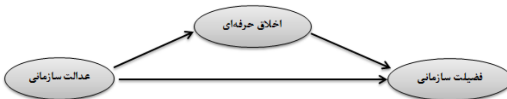
شکل ۱. الگوی مفهومی تحقیق

پاسخ‌گویی به این سؤال هستند که نقش میانجی‌گری اخلاق حرفه‌ای در بررسی رابطه بین عدالت سازمانی و فضیلت سازمانی ادارات ورزش و جوانان استان چهارمحال و بختیاری چگونه است؟